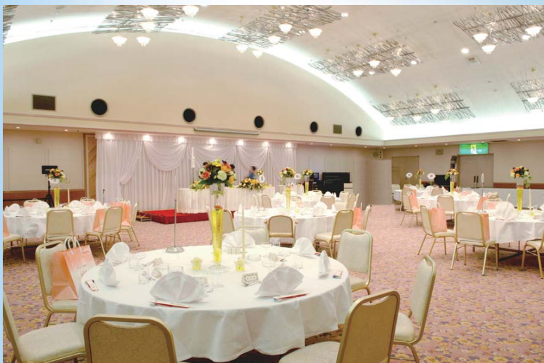
武蔵(296.7㎡) 着席180名 立食300名様迄