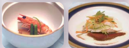
お料理の一例です