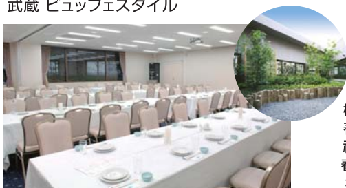
橘 角テーブルスタイル

和室(神地)8畳+6畳 15名様 石庭付きのしっとりとしたお座敷 はご会食、ご法要、PTAやお祝 いの席にぴったりです。