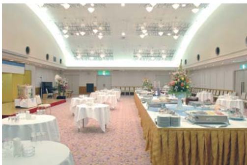
武蔵 ビュッフェスタイル

アーチを描く高い天井、広々とした美しい会場は、多彩なスタイルに対応いたします。ホテル精養軒の美味しいお料理と、温かいサービスで皆様をお迎え致します。